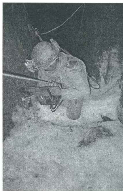
Installatie van het netje

Iedereen die over deze helling afdaalde schopte zoveel sneeuw en steentjes los, dat het gevaarlijk was om daaronder af te dalen. Met de Hilti vier gaten geboord en het netje vastgezet met keilbouten. Wel een koude bedoening om in de tocht een half uur op de sneeuw en ijs te zitten. Na een uurtje stonden we weer buiten. Netje geplaatst, missie geslaagd. De dia's hopelijk ook. Lekker in de zon weer opwarmen en naar de auto lopen. De equipeer ploeg kwam tegen de avond de grot weer uit en hadden tot -320m kunnen equiperen.